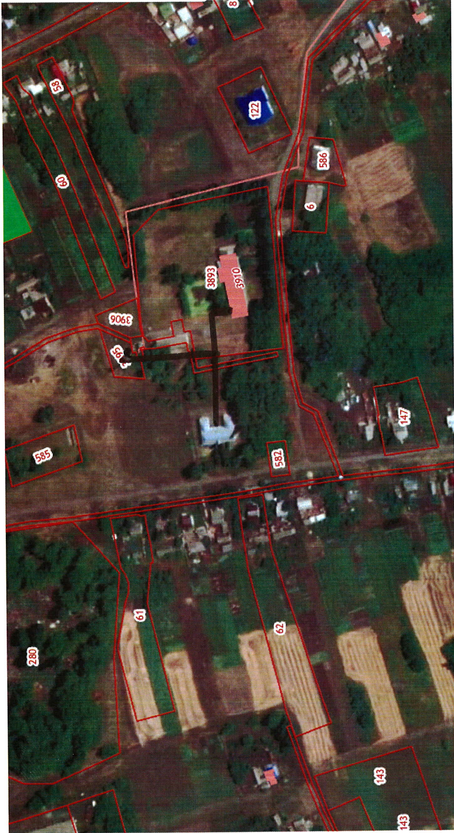
Схема теплоснабжения Верхнемазовского сельского поселения Верхнехавского муниципального района Воронежской области